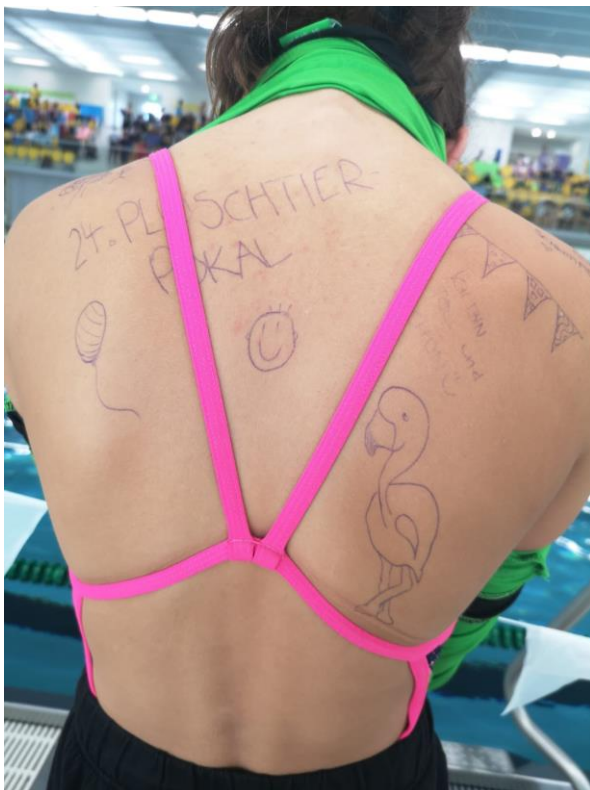
schöne Werbung und einer der Flamingo-Gewinner

Trotz Einschränkungen war es ein gelungener Wettkampfauftakt und wir hoffen, dass vielleicht der ein oder andere Verein auch in „Nicht-Corona-Zeiten“ den Weg wieder nach Dresden findet und um das nächste Wassertier kämpfen wird.