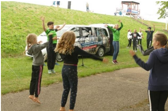
Mit Erwärmung für die Kleinsten ging's los

Am 05. September, eine Woche nach Schulbeginn, haben sich 247 Teilnehmer mit gebührendem Abstand in den Stausee Cossebaude gewagt. Einer gewissen Tradition folgend, war das Wetter nicht hervorragend und der Stausee deutlich kälter als das Wasser in der Schwimmbhalle.