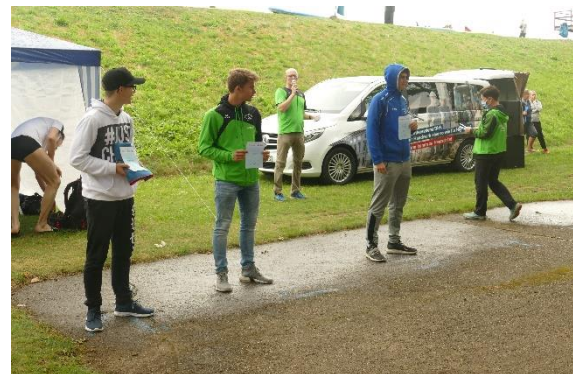
Auch hier Siegerehrung mit Abstand