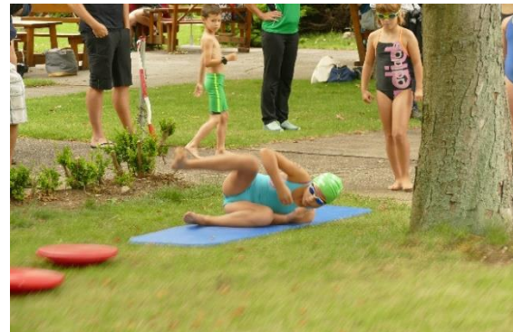
nach einer kurzen Hindernisstrecke