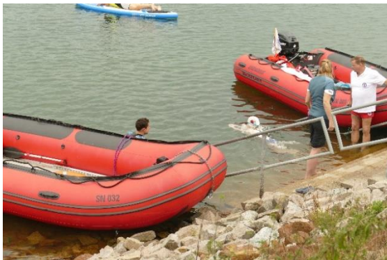
mussten 100 Meter geschwommen werden