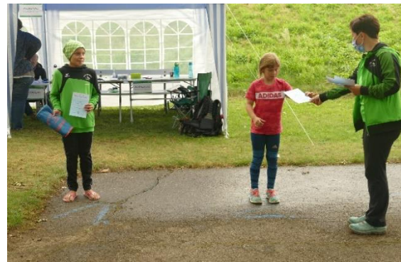
Hinterher Siegerehrung mit Abstand