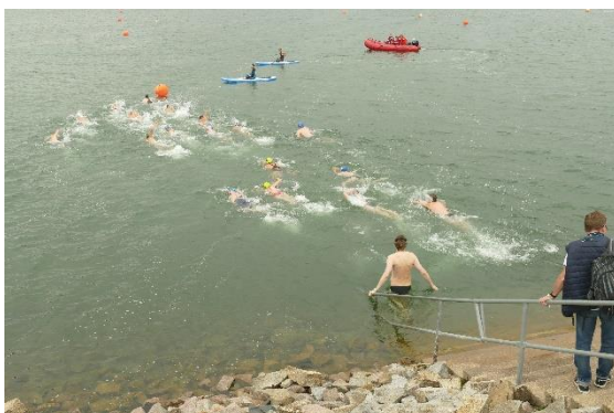
Die Größeren starteten in kleinen Gruppen